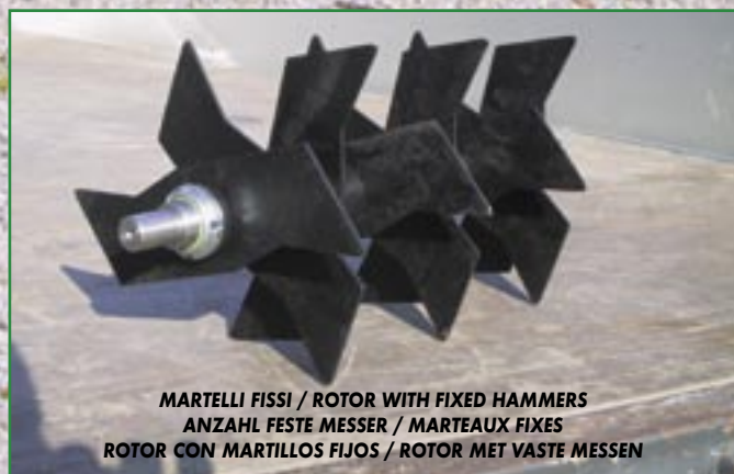
MARTELLI FISSI / ROTOR WITH FIXED HAMMERS ANZAHL FESTE MESSER / MARTEAUX FIXES ROTOR CON MARTILLOS FIJOS / ROTOR MET VASTE MESSEN